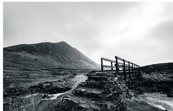
Winnaar Bondsklasse Zilver bij Fotonationaal 2014 van Jasper van Donge, Shooters Beuningen.

Onder het motto "een goed begin is het halve werk" zullen een aantal enthousiaste leden van de Beuningse Shooters fotoclub, in het weekend van 24 januari naar Trier afreizen. Deze stad, één van de oudste van Duitsland, is gelegen aan de Moezel en staat bekend om zijn prachtige